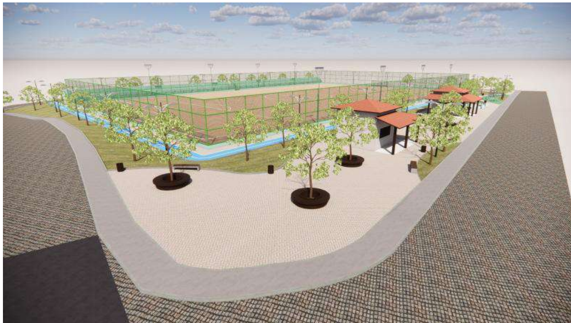
Figura 01 - Perspectiva geral da praça e implantação integrada.

As imagens abaixo representam a concepção arquitetônica do empreendimento, demonstrando a integração entre campo de futebol, pista de caminhada, quiosques, academia ao ar livre, parque infantil, paisagismo, arquibancadas e áreas de convivência.