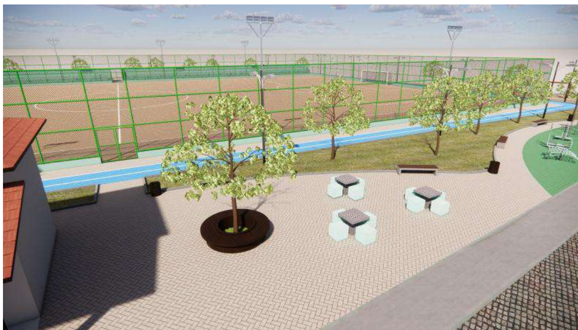
Figura 03 - Mesas de jogos e área de permanência.