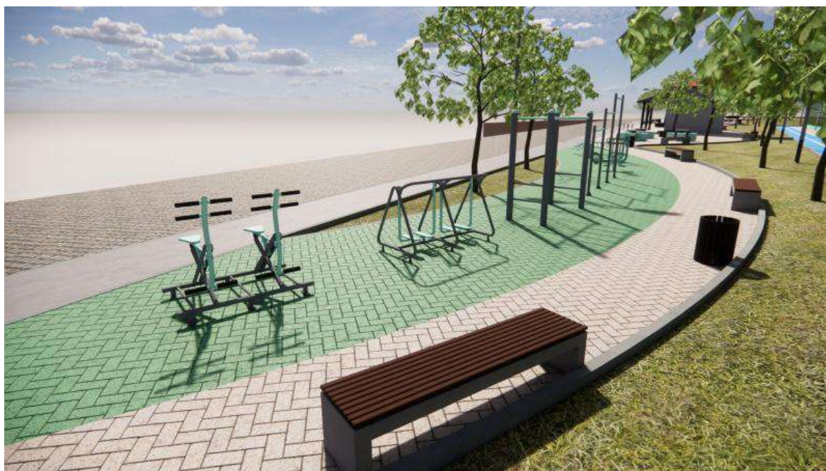
Figura 06 - Integração da academia com circulação e arborização.