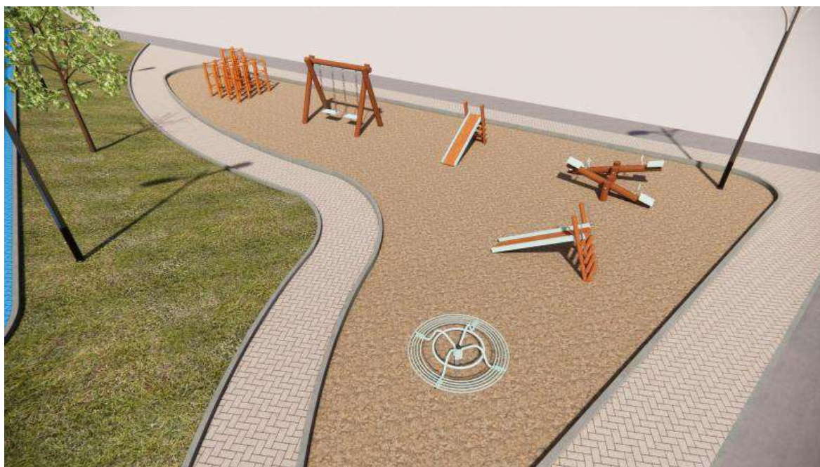
Figura 07 - Parque infantil com brinquedos e piso em areia lavada.