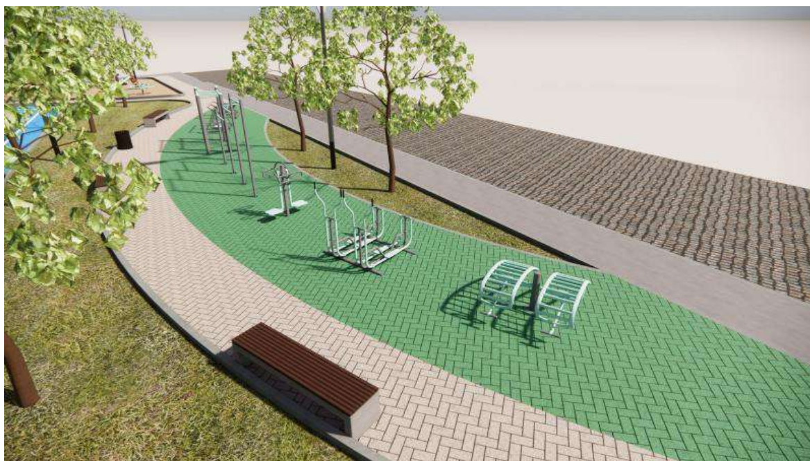
Figura 04 - Academia ao ar livre com piso intertravado verde.