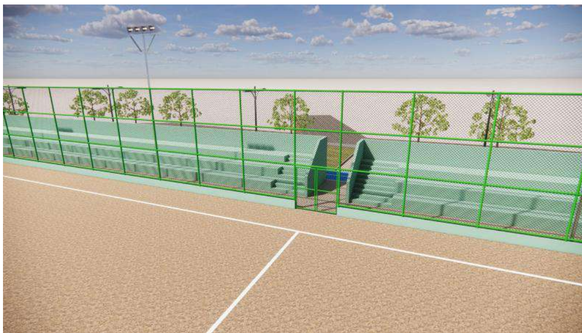
Figura 09 - Arquibancadas, alambrado e campo de futebol.