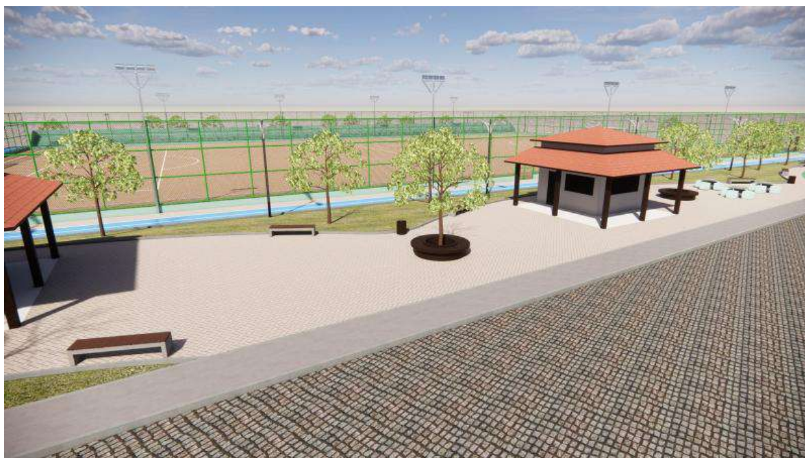
Figura 02 - Área dos quiosques, convivência e circulação.