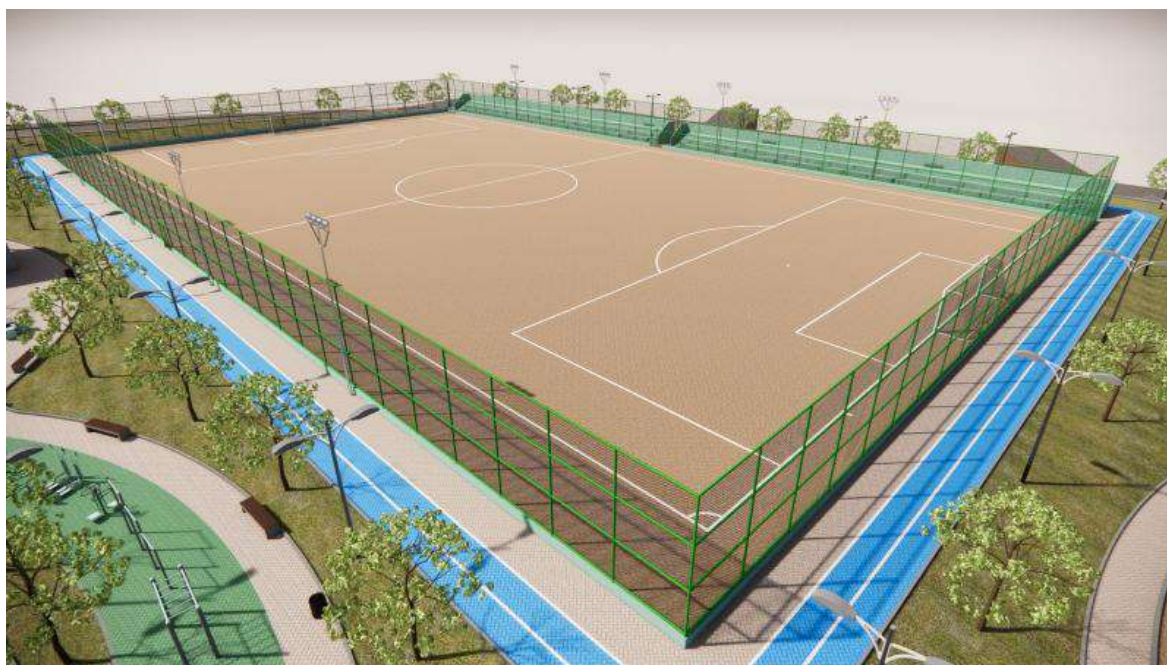
Figura 08 - Campo de futebol em terra compactada e iluminação esportiva.