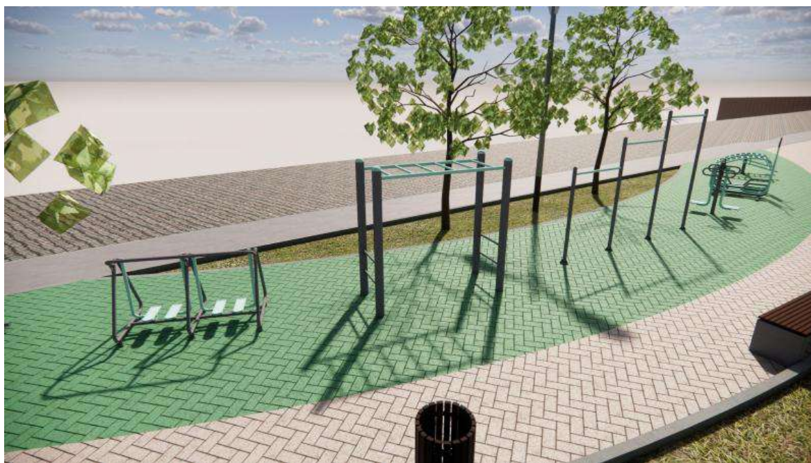
Figura 05 - Equipamentos de ginástica e paisagismo.